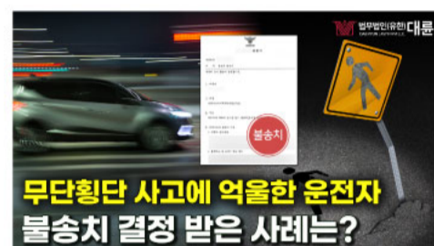
무단횡단 사고에 억울한 운전자 불송치 결정 받은 사례는?