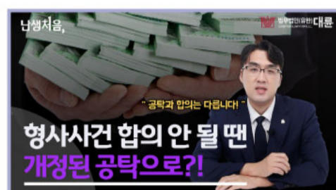
형사사건 피해자 등의 없이 형사공탁 가능할까?