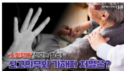
'노인학대' 신고의무와 가해자 처벌에 대해 알아본다면?