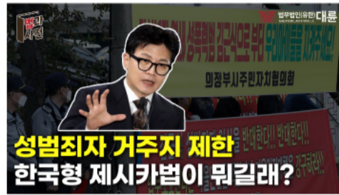
성범죄자 거주지 제한, 한국형 제시카법