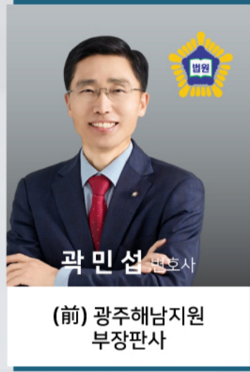
곽민섭 변호사 (前) 광주해남지원 부장판사