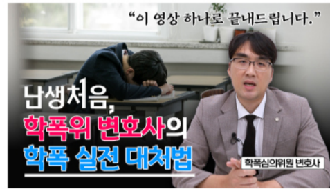
'학교폭력' 학폭심의위원 변호사의 실천 대처법